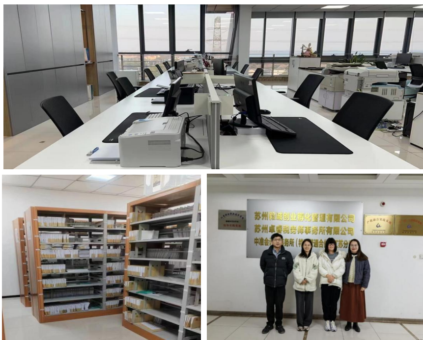
图1 苏州卓睿税务师事务所企业照片

江苏省吴中中等专业学校为区域重点中职学校，财经系大数据与会计专业为省级示范专业，办学定位与区域产业需求高度契合。该专业课程体系涵盖会计核算、税费计算、财务软件应用等核心内容，配备专业实训设备与“双师型”教师队伍，在校生规模稳定。双方在人才培养目标、专业建设方向上高度匹配，为共建卓睿智能财税产业学院、深化产教融合奠定了坚实基础。